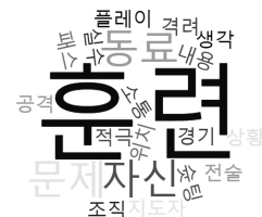
그림 5. 대학생축구선수 소통 경향성 워드클라우드.

중국 대학생축구선수 소통 핵심어 추출을 위한 개방형설문 결과 총 347개의 문장이 수집되었다. 수집된 문장에서 511개 단어가 추출되었으며, 추출된 단어의 빈도 누적 결과 소통 핵심어로 157개가 도출되었다. 대학생축구선수의 소통에서 빈번하게 사용하는 단어는 훈련 59회, 자신 17회, 동료 16회, 문제 16회, 패스 15회 등의 순으로 나타났다. 전체 단어 중 빈도수가 높았던 상위 20개 중국 대학생축구선수 소통 핵심어 사용 양상은 <그림 5>와 같다.