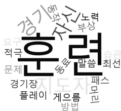
그림 3. 중학생축구선수 소통 경향성 워드클라우드.

중국 중학생축구선수 소통 핵심어 추출을 위한 개방형설문 결과 총 294개의 문장이 수집되었다. 수집된 문장에서 326개 단어가 추출되었으며, 추출된 단어의 빈도 누적 결과 소통 핵심어로 126개가 도출되었다. 중학생축구선수의 소통에서 빈번하게 사용하는 단어는 훈련 48회, 자신 23회, 경기 21회, 지도자 17회, 동작 11회 등의 순으로 나타났다. 전체 단어 중 빈도수가 높았던 상위 20개 중국 중학생축구선수 소통 핵심어 사용 양상은 <그림 3>과 같다.