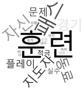
그림 2. 청소년축구선수 소통 경향성 워드클라우드.

소통 핵심어 추출을 위한 단어의 출현 빈도 누적 결과 훈련 151회, 패스 62회, 자신 50회, 경기 42회, 동료 38회 등의 순으로 나타났다. 공은 42회로 빈도수가 높았지만 종목 특성상 관용적인 표현으로 의미나 주제를 표현하지 못한다는 전문가회의 합의에 따라 제거하였다. 이를 토대로 중국 청소년축구선수가 소통에서 사용이 빈번한 핵심어 20개를 워드클라우드에 <그림 2>와 같이 시각화하였다.