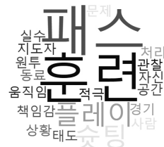
그림 4. 고등학생축구선수 소통 경향성 워드클라우드.

중국 고등학생축구선수 소통 핵심어 추출을 위한 개방형설문 결과 총 327개의 문장이 수집되었다. 수집된 문장에서 455개 단어가 추출되었으며, 추출된 단어의 빈도 누적 결과 소통 핵심어로 136개가 도출되었다. 고등학생축구선수의 소통에서 빈번하게 사용하는 단어는 훈련 44회, 패스 41회, 플레이 18회, 슈팅 14회, 동료 12회 등의 순으로 나타났다. 전체 단어 중 빈도수가 높았던 상위 20개 중국 고등학생축구선수 소통 핵심어 사용 양상은 <그림 4>와 같다.