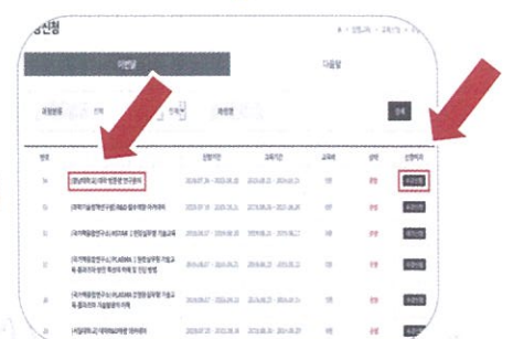
4. 교육 월/일, 과정명 확인 후 클릭! 또는 바로 수강신청 버튼 클릭!