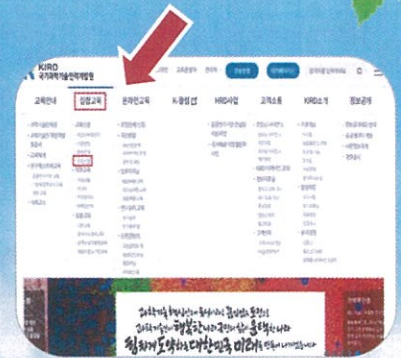
3. 상단 메뉴 중 "수강신청" 클릭!