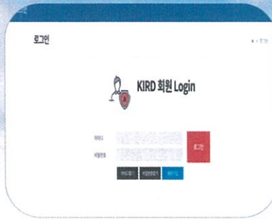
2. 회원가입 후 로그인