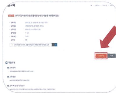
5. 교육일시, 장소, 교육 안내문 확인 후 "수강신청" 클릭!