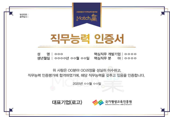
< 매치업 직무능력 인증서 >