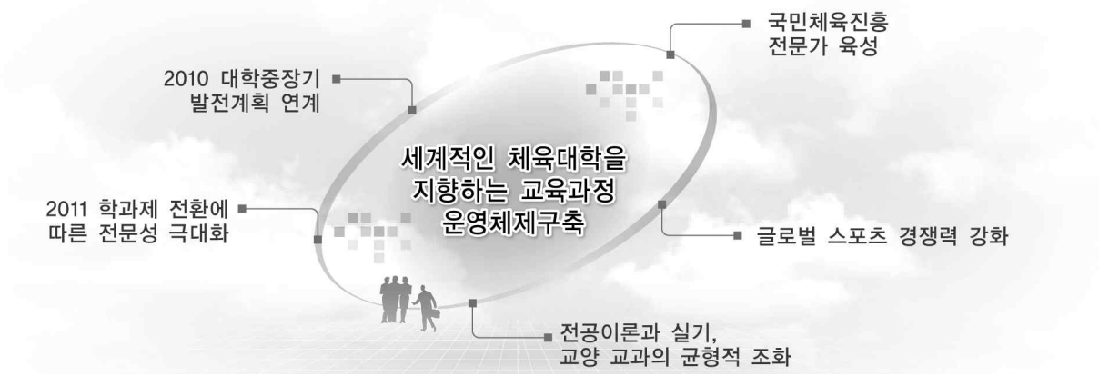
[그림 II-8-1] 한국체육대학교 교육과정 구축의 기본 방향